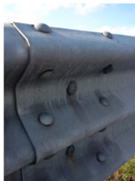
Figura 3 – Esempi di non integrità dei dispositivi di sicurezza

Con riferimento ai supporti (cordoli in c.a. per le barriere bordo ponte o il terreno per le barriere infisse), si evidenzia come la perdita di efficienza del supporto possa essere riscontrata sia direttamente che indirettamente (ad esempio, l'assenza di verticalità o la riduzione di quota delle barriere infisse può essere dovuta alla presenza di cedimenti delle banchine o dei terreni poco compattati). Dovranno quindi essere valutate, tra le altre, le seguenti possibili anomalie: