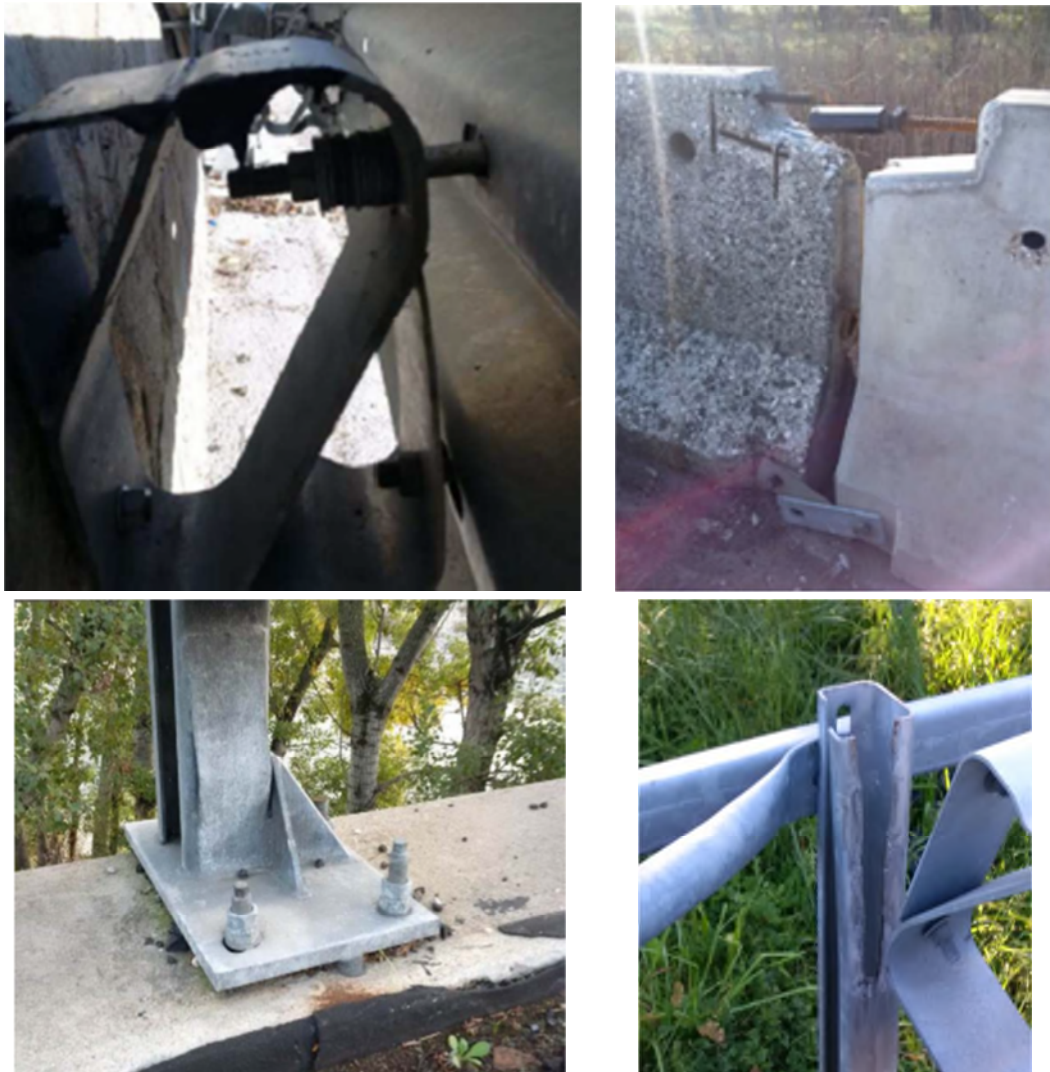
Figura 2 – Esempi di non conformità dei dispositivi di sicurezza

Occorre verificare lo stato di conservazione (o di degrado) dei dispositivi, valutando la presenza delle seguenti possibili anomalie (Figura 3):