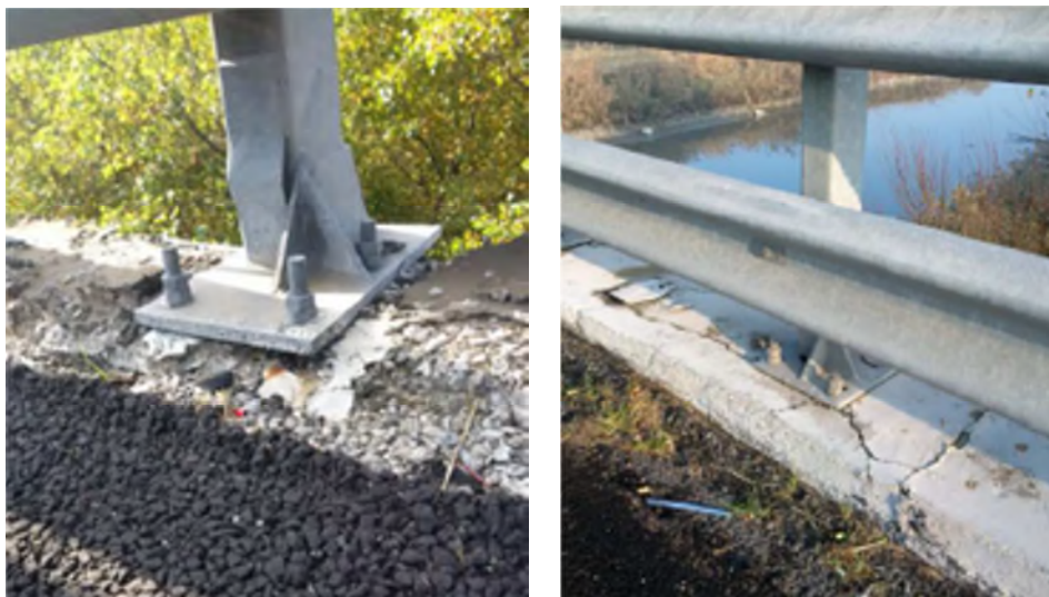
Figura 4 – Esempi di non integrità dei supporti delle barriere di sicurezza.

La constatazione di disallineamenti localizzati attiva un approfondimento immediato attraverso verifica puntuale, secondo le modalità riportate nel paragrafo 3.3.